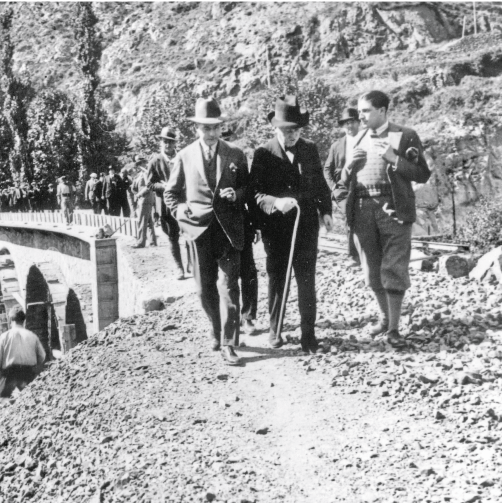
ARXIU DELS FERROCARRILS DE LA GENERALITAT DE CATALUNYA