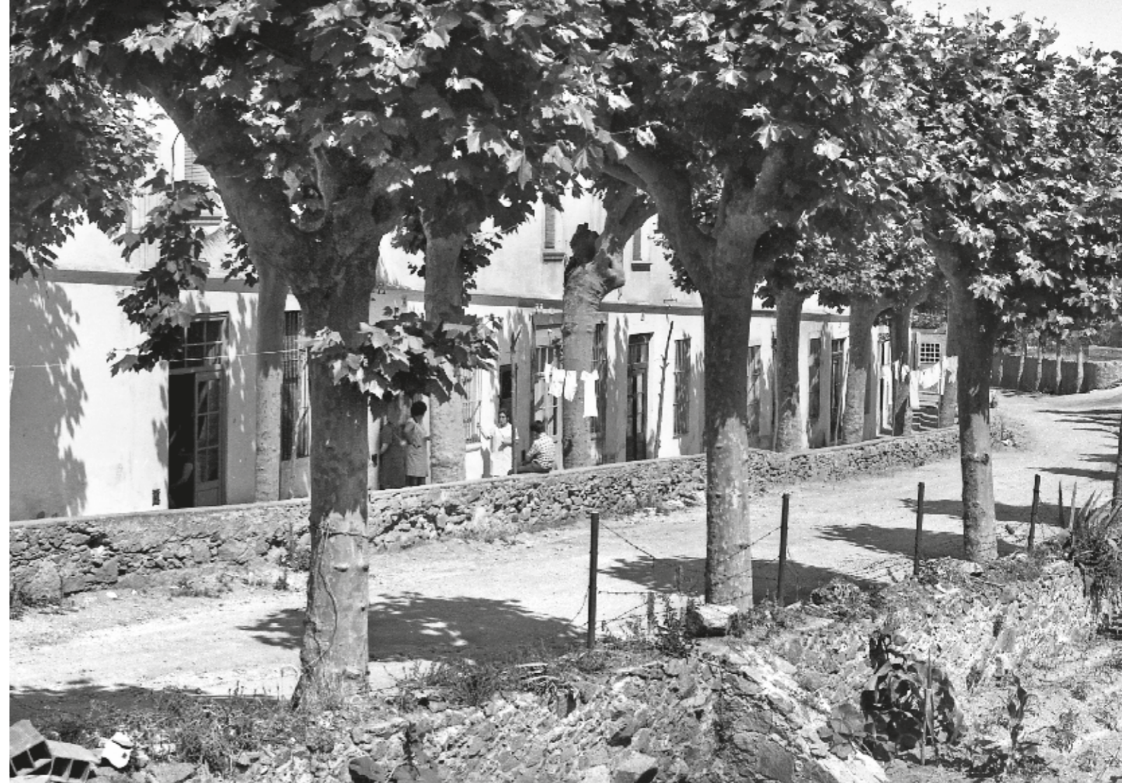
LLUÍS FOLCH SOLER / AMWD - FONTS FOLCH

El Vilassar d'avui també és fruit de la perseverança dels vilassarencs per construir una comunitat, i no es