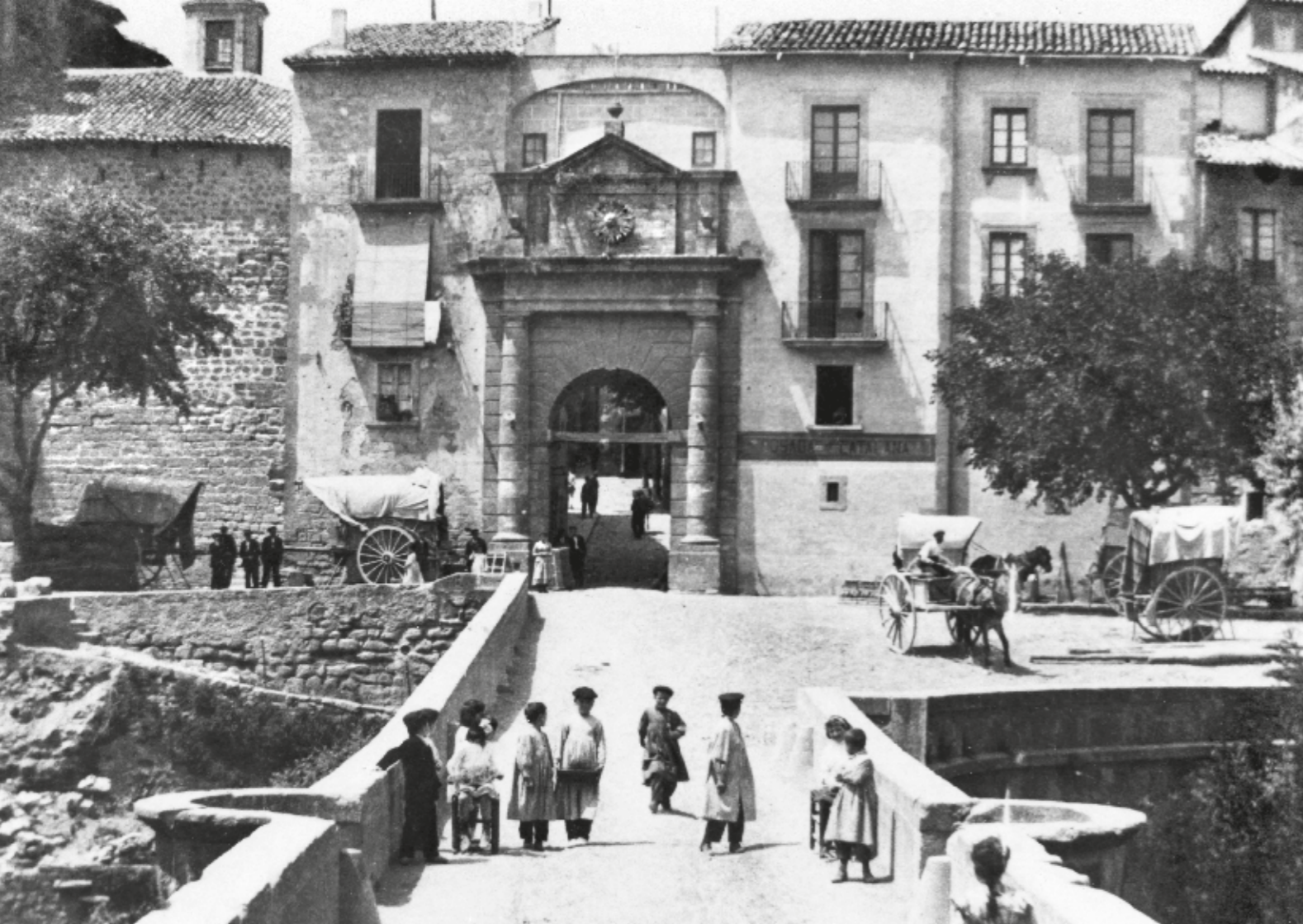
JOSEP COLELL / ACS - FONS ANTONI VILA MONRABA