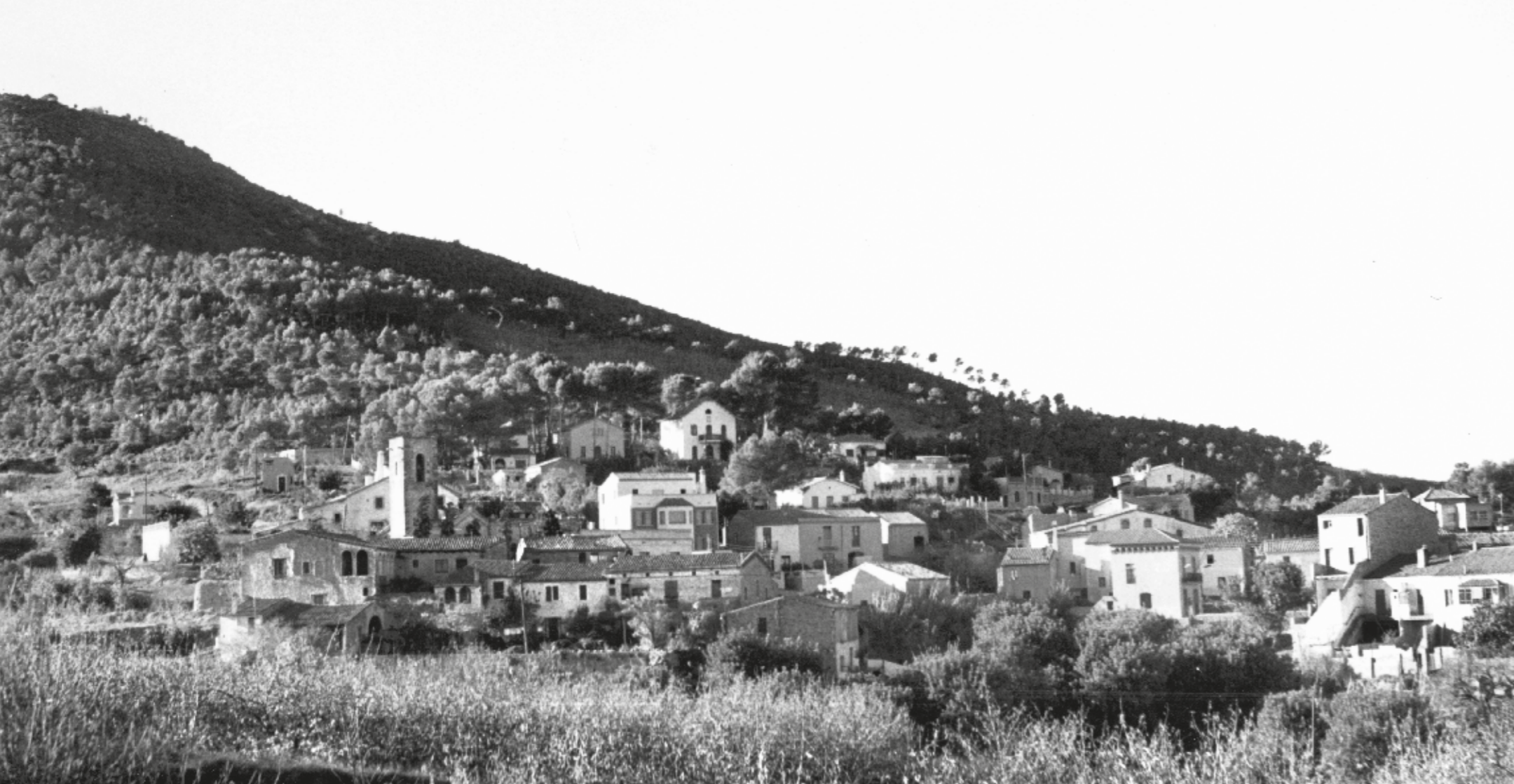
ANTONI COMELLAS / COL·LECCIÓ JOSEP COMELLAS