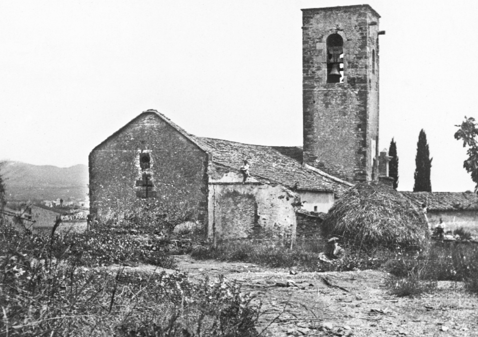
JOAN ESTORCH / AFCEC