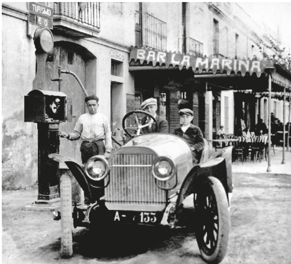
CLAUDI DE JOSÉ / FONTS CLAUDI DE JOSÉ GOMAR

A la imatge, dels anys trenta, apareixen la benzinera i el Bar La Marina, de can Passió, i l'escala d'accés a una escola que també fou seu de l'Ajuntament abans de la construcció de les actuals cases consistorials.