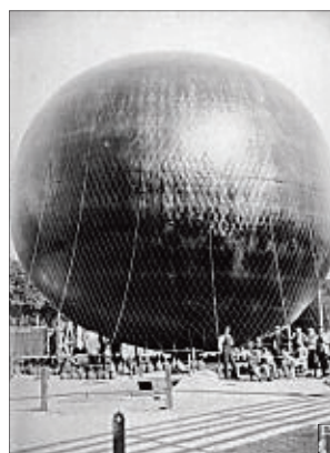
«Barcelona desconeguda» recoge numeroso material poco conocido de los archivos de la ciudad

«Barcelona desconeguda», publicado por Efadós, nos ofrece un recorrido insólito por calles y gentes, una visita insólita a Barcelona que se inicia en el puerto, con la fachada marítima en el siglo XIX, el principal paseo de la ciudad desde el XVIII. Venteo nos traslada también al Eixample antes de la puesta en marcha del Pla Cerdà que revolucionaría el paisaje urbanístico de esta zona para siempre.