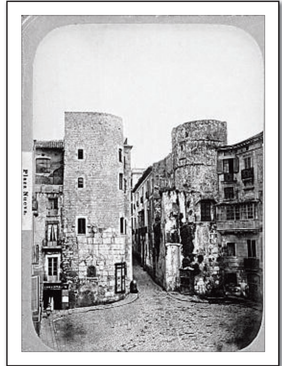
El libro visualiza en imagen la evolución vivida en Barcelona