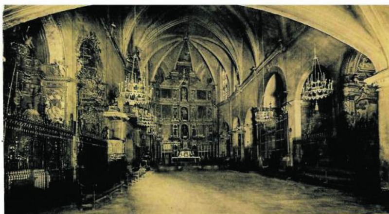
REUS — Interior de l'Església Parroquial de Sant Pere Interior de la Iglesia Parroquial de San Pedro