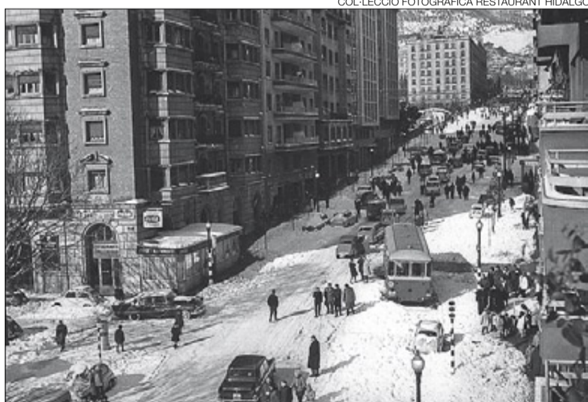
COL·LECCIÓ FOTOGRAFICA RESTAURANT HIDALGO