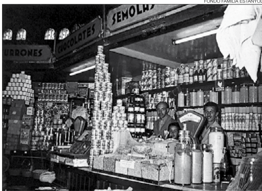
FONDO FAMILIA ESTANYOL

►► Fascicles col·leccionables de periodicitat setmanal. Llibreries i quioscos de Sant Gervasi. 2,95 euros.