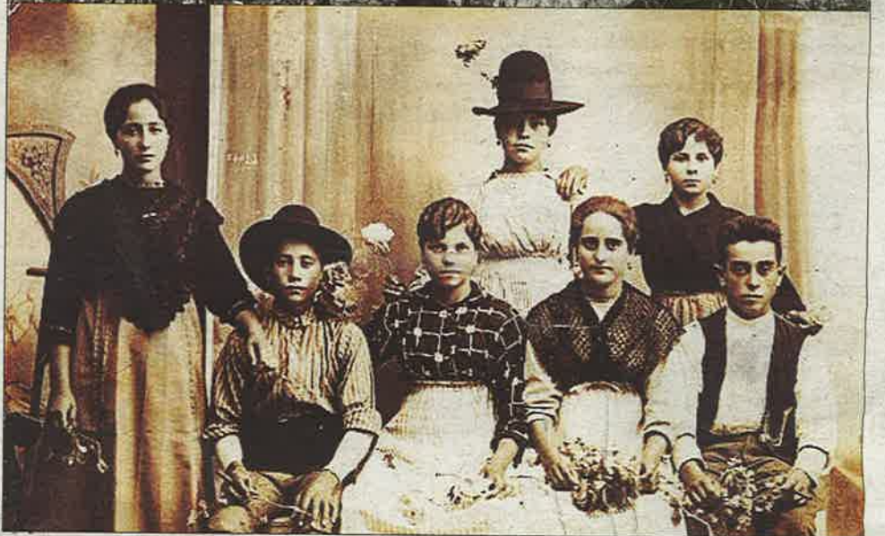
A dalt, una colla d'hòmens sega arròs a mà davant d'un dels ponts del Rei cap al 1920. Al mig apareix una noia amb un càntir i una bóta a les mans que feia d'aiguadera. A baix, uns amics i veïns de Jesús i Maria que van anar a les festes de la Cinta de Tortosa per veure'n la processó i els focs el 1921. Van aprofitar que anaven mudats per fer-se aquest original retrat a l'estudi de Ramon Andreu.

del cementiri del qual no se'n conservava cap record de l'interior del temple. També hi ha un extens capítol dedicat al treball de la terra i, sobretot, al cultiu de l'arròs, així com al curs de la vida quotidiana, la indumentària, la família i les celebracions. Les fotografies més antigues que es conserven són retrats d'estudi que els avantpassats anaven a fer-se als primers fotògrafs instal·lats a Tortosa a partir del 1864. També es recullen moltes imatges relacionades amb els oficis, bars i comerços, i de les