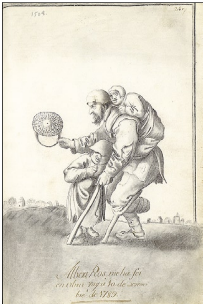
LES IMATGES ▶ De dalt a baix, carnet sanitari d'una prostituta (1890); dibuix d'un discapacitat en un llibre del Gremi d'Argenters (1789); foto de Forcano d'una dona demanant almoina al carrer de Montcada, el 1963; supervivents jueus dels camps nazis al port de Barcelona (1945); foto de Pérez de Rozas dels bombardejos del 1937 i esbós d'un esclau del segle XV.