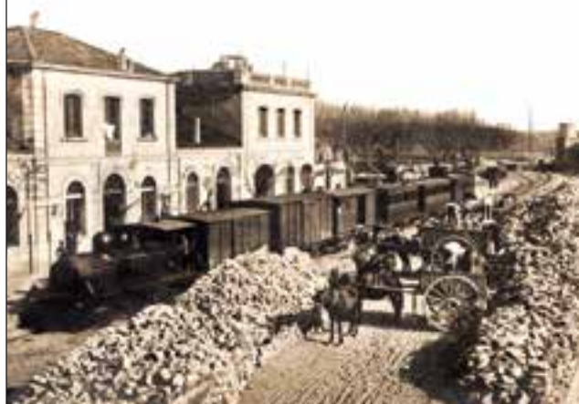
Estació de Caldes de Montbui, el 1912, plena d'adoquins per pavimentar Barcelona.

EL FERROCARRIL A CATALUNYA Lluís Miquel Tuells