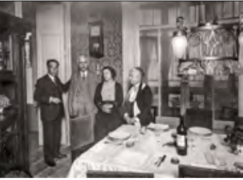
El retorn de Macià a Barcelona. Torí de la Catalunya resident Francisco Macià va tornar a Barcelona després d'un exili de 27 anys. El 27 de setembre de 1930, el president de la Generalitat de Catalunya va tornar a Barcelona. El 27 de setembre de 1930, el president de la Generalitat de Catalunya va tornar a Barcelona.