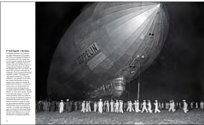
El Graf Zeppelin a Barcelona El dirigible alemany Graf Zeppelin, propietari de la línia de vols aerostàtics de 1929, va arribar a Barcelona el 24 d'octubre de 1930. El dirigible va ser el primer a arribar a Catalunya. El dirigible va ser el primer a arribar a Catalunya. El dirigible va ser el primer a arribar a Catalunya.