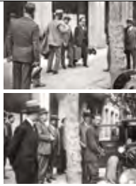
Macià, el retorn de la Catalunya resident Francisco Macià va tornar a Barcelona després d'un exili de 27 anys. El 27 de setembre de 1930, el president de la Generalitat de Catalunya va tornar a Barcelona. El 27 de setembre de 1930, el president de la Generalitat de Catalunya va tornar a Barcelona.