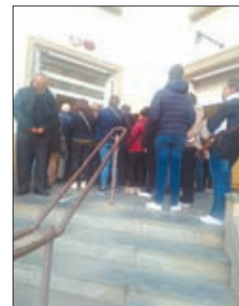
Aglomeració davant del CAP

Els usuaris del CAP Eixample, situat a l'avinguda de Balmes, es van veure enfrontats a una situació quan intentaven accedir a les instal·lacions. A les vuit del matí, l'hora d'obertura, una considerable quantitat de persones formaven una cua al carrer. Segons va denunciar un dels usuaris, que va apuntar que "això no ho havia vist mai", quasi un quart d'hora després "encara no havia passat ningú".